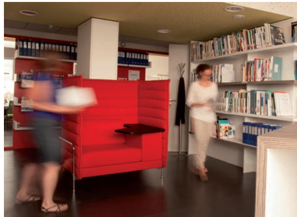
Un espace accueillant

Ce centre de documentation est également accessible au public, principalement les élus, chercheurs, étudiants et professionnels.