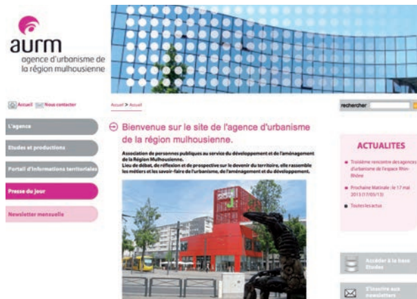
Un site Internet complet et actualisé