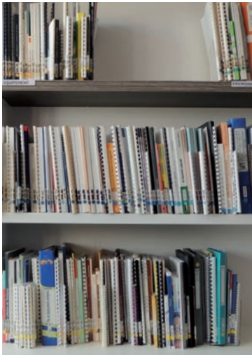
Un service mutualisé